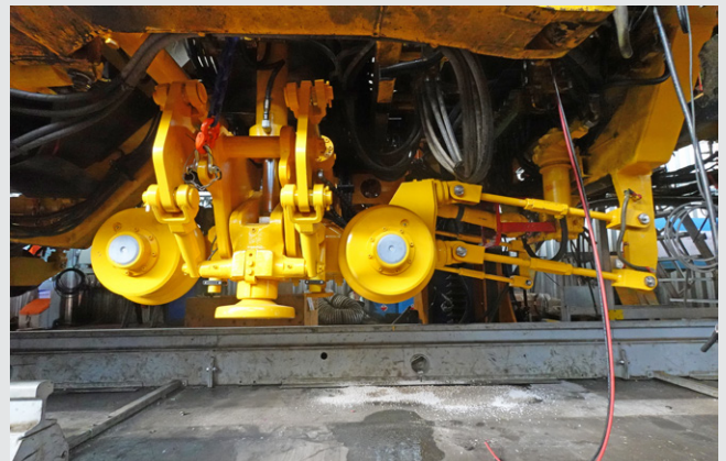
3: Aggregat zur dynamischen Gleisstabilisation vor Aufarbeitung nach vielen Einsatzjahren (links), überholtes Arbeitsaggregat (rechts)