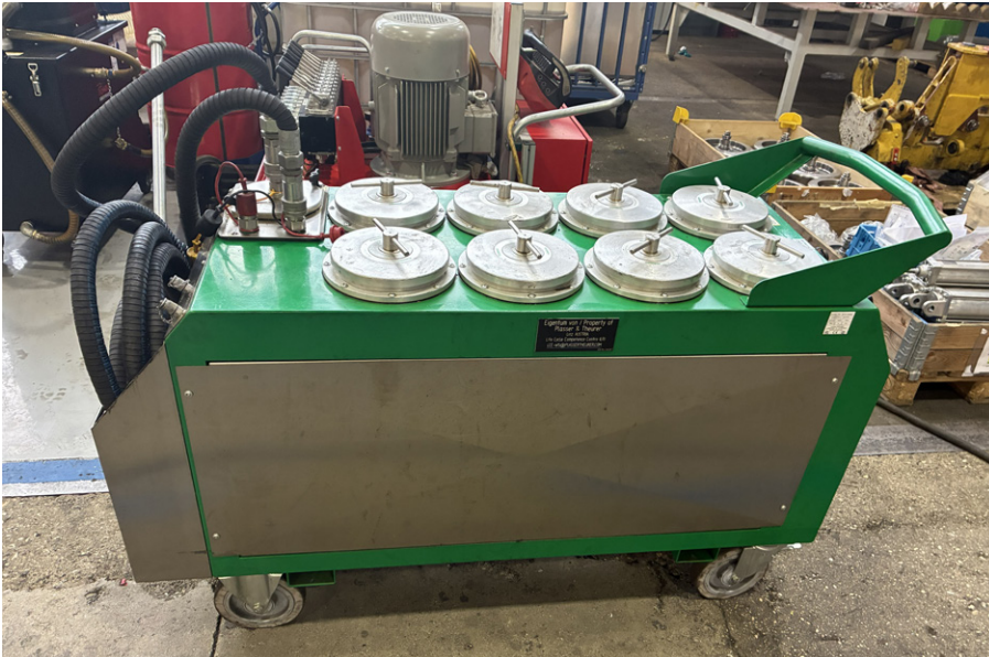
5: Der gezielte Einsatz umweltfreundlicher Betriebsstoffe und deren Wiederaufbereitung reduziert Abfall und verringert Emissionen aus der Produktion von Neuölen